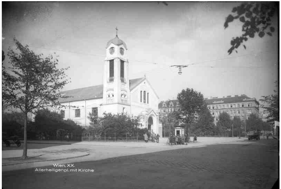
Viertel um den Allerheiligenplatz

Im Sommer 1905 wurde eine Allerheiligenkirche (Notkirche) im südlichen Winkel des Allerheiligenparks als Filialkirche der Brigittakirche errichtet und am 26. November 1905 eingeweiht. Weil das zur Verfügung stehende Geld knapp war, wurde diese nach Entwürfen von Hans Schneider (1860–1921) errichtete Kirche einfach gehalten. Sie war einschiffig und hatte einen offenen Dachstuhl, der Kirchenraum maß 40 mal 20 Meter und hatte einen seitlich angelehnten Turm. Vom früheren Hochaltar im Schottenstift wurde der Kirche ein Altarbild von Joachim von Sandrart übergeben. Die Kirche wurde im Zweiten Weltkrieg am 7. Februar 1945 durch Bomben völlig zerstört. Auf Allerheiligenplatz 5 steht im Straßenverband das ebenfalls denkmalgeschützte Pfarrhofgebäude.